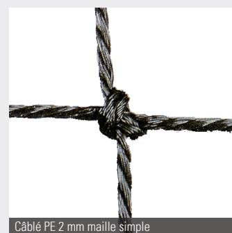
Câblé PE 2 mm maille simple