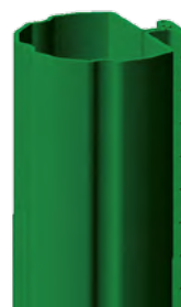
Profil du poteau Aquigraf® Ø50mm