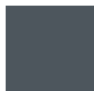
Gris 7016 B