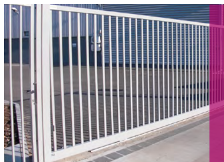
Portail Practis® L coulissant

Branchement très rapide de tous les éléments tels que gyrophares, éclairages de zone, claviers codés, lecteurs de badges grâce aux «pieuvres» de connexion Plug and Play.