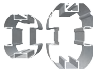
Vue de coupe à l'échelle des 2 poteaux KOLOSS® 1000 A et 2600 A