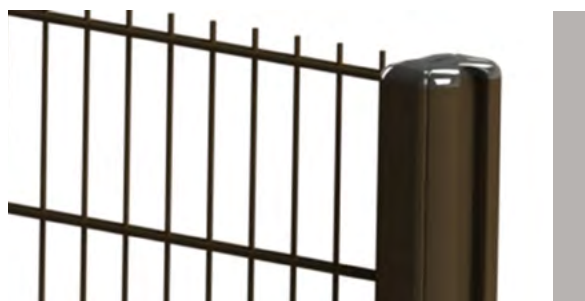
Profil des poteaux KOLOSS® 1000 A

Lors d'un scellement, le béton est exposé au risque de gel : les résidus d'eau peuvent faire éclater le poteau ; prévoir un drain en fond de scellement.