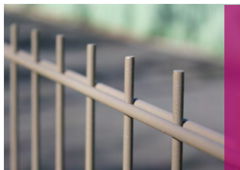
Clôture avec des panneaux - AQUILON® 656 Premium

Nous déclinons toute responsabilité si des pare-vues sont installés sur nos clôtures.