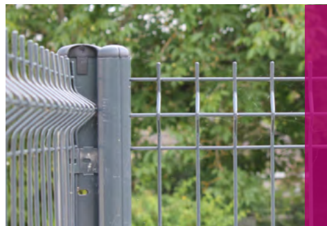
Clôture avec des panneaux AQUILON® 55 Premium

Nous déclinons toute responsabilité si des pare-vues sont installés sur nos clôtures.