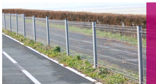
Clôture avec des panneaux AQUILON® 55 Bord de mer - ZnAl plastifiés

Nous déclinons toute responsabilité si des pare-vues sont installés sur nos clôtures.