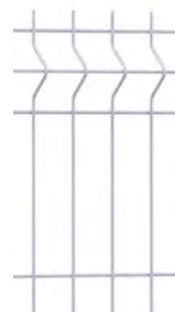
Panneau AQUILON® 55 bord de mer